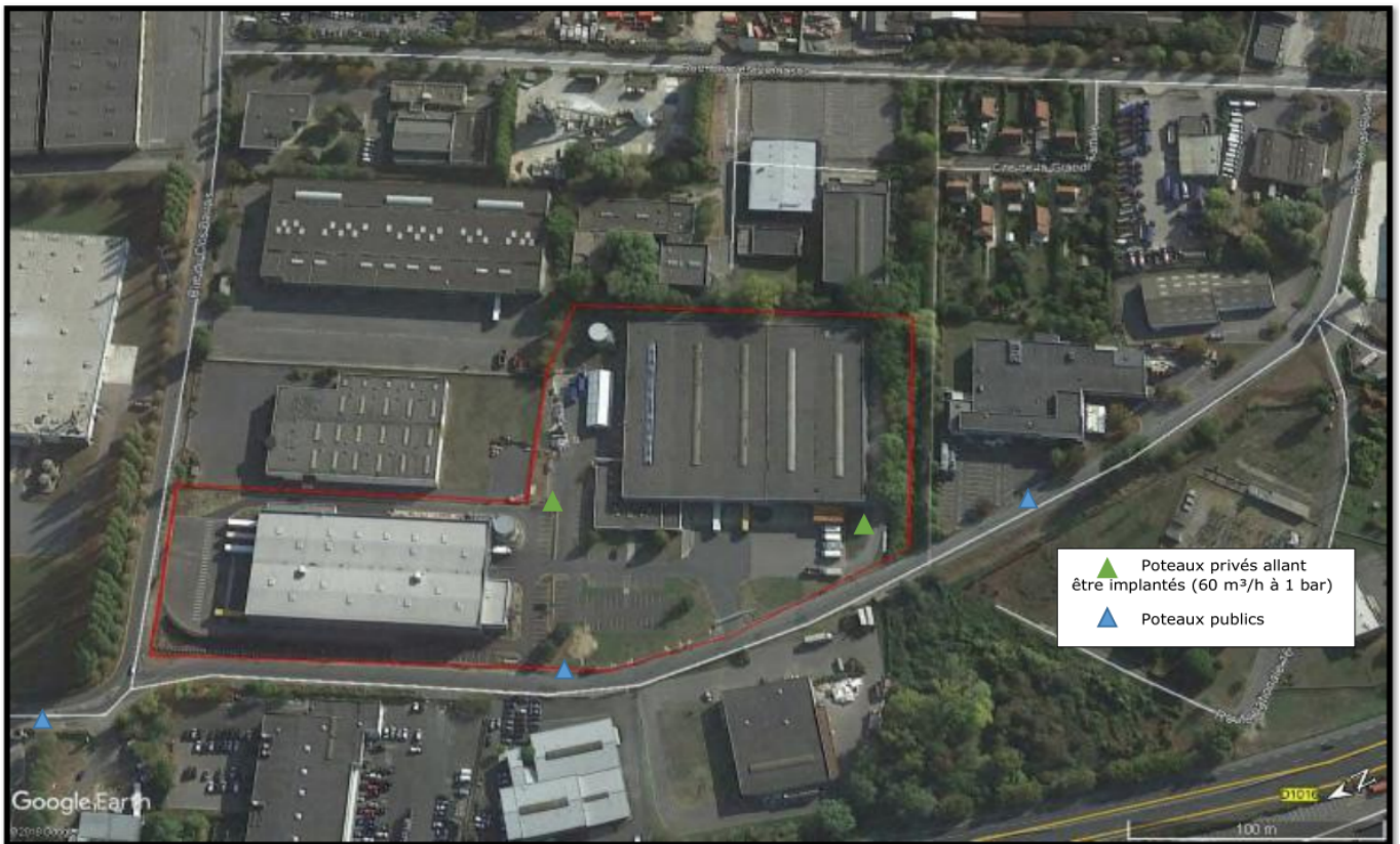
Plan du site avec les bâtiments NS01 à droite et NS02 à gauche